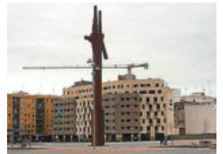
Escultura de Navarro a Mislata.

ha preguntes que no tenen resposta perquè, senzillament, estan mal formulades. Si preguntem quanta gent, a Catalunya, no trobaria del tot malament separar-se d'Espanya, per raons identitàries, econòmiques o pel que siga, trobarem que prou per sostindre un partit mitjà (en cap cas majoritari, de moment). I l'anticatalanisme furibund que triomfa en bo-