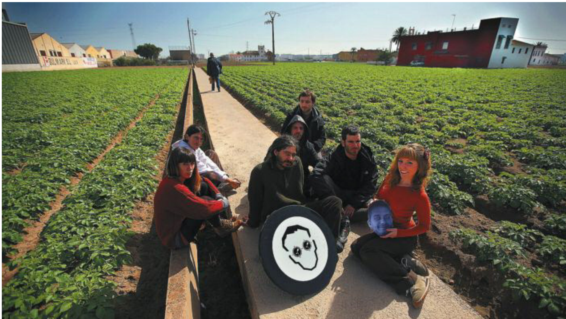
Components del grup Orxata Sound System fotografiats a l'horta d'Alboraia.