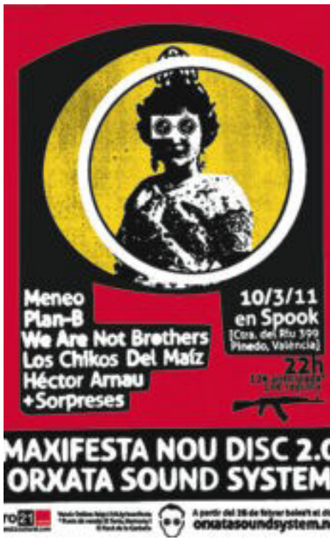
Cartell de la Maxifesta a la discoteca Spook.

Ben aviat, la proposta d'Orxata es va demostrar vàlida i, d'alguna forma, necessària. Amb la seua primera maqueta, el 2006, guanyaren el premi al grup revelació en els Ovidi Montllor. I dos anys després s'adjudicaven el guardó al millor disc de