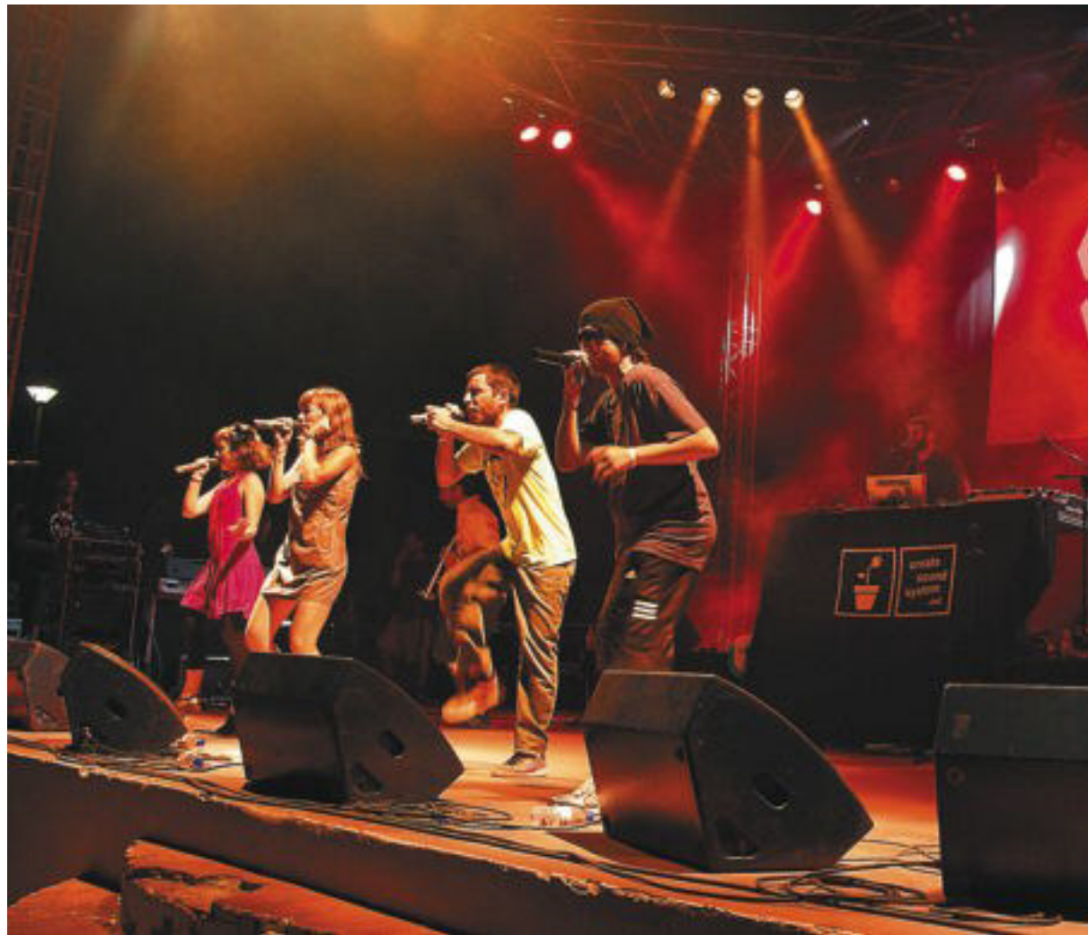
El grup Orxata Sound System durant una de les seues elèctriques actuacions.

Bakalao per a gent d'ara. L'ombra d'aqueix culte ha arribat com a mite a Orxata Sound System. El grup, creat en el nou segle, és una formació que sempre ha fet un ús innovador de les noves tecnologies populars de comunicació i han oferit facilitat per a baixar-se les seues cançons, i fins i tot han usat Twitter perquè el públic generara els versos d'una cançó, Suavitat Universal . La seua actitud és pròxima a la d'una festa rave muntada amb humor i amb respecte al bagatge de l'ús del valencià i la música d'arrels. No sols d'ací, ja que en 2.0 , el seu nou treball, exploren la connexió entre el passat i el futur que ofe-