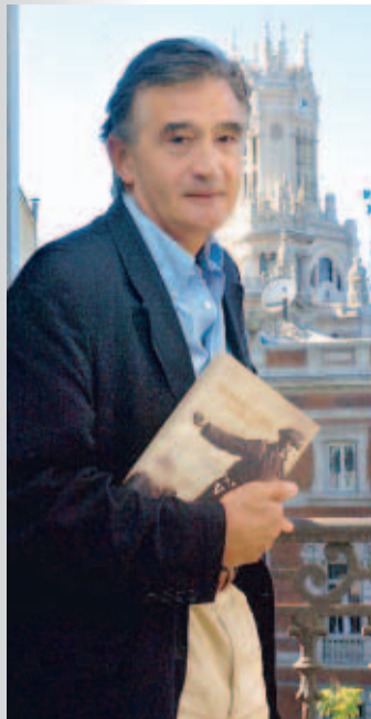
ÁNGEL DÍAZ / EFE