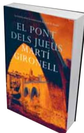
El pont dels jueus Martí Gironell Columna

Els autors de novel·la històrica aspiren a transportar-nos a l'època descrita. Un dels recursos que tenen és el llenguatge. No demano que s'utilitzi el català del segle XI, però calia anomenar el pont infraestructura ? Un no pot evitar