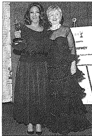
Winfrey i Clinton

El pilot italià de Fórmula 1 Giancarlo Fisichella s'ha quedat sense carnet. Diumenge va ser detingut per la policia quan circulava a 148 km/hora a les 6 del matí en una via perifèrica de Roma.